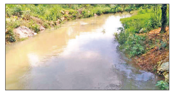
दोहान में नदी में चलता अतिरिक्त पानी।