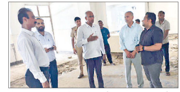
महेन्द्रगढ़। नागरिक अस्पताल के नए भवन का निरीक्षण करते विधायक एवं एसडीएम।