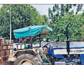
नारनौल। अवैध खनन में पकड़े गए वाहन।

प्रदेश के मुख्यमंत्री नायब सिंह सैनी की अवैध खनन के खिलाफ पारदर्शी और जीरो टॉलरेंस नीति का सीधा असर महेंद्रगढ़ जिले में दिख रहा है। इसी नीति के तहत जिला प्रशासन व खनन विभाग ने मिलकर पिछले 10 दिनों में अवैध खनन और खनिज के अवैध परिवहन पर लगातार कड़ी कार्रवाई की है। इसके परिणाम स्वरूप 12 वाहनों को जब्त किया गया है और लाखों रुपये का जुर्माना वसूला गया है। इसके अलावा खनिज के अवैध परिवहन