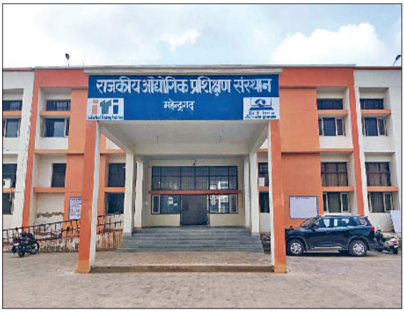
राजकीय औद्योगिक प्रशिक्षण संस्थान महेन्द्रगढ़।

औद्योगिक प्रशिक्षण संस्थान में शुकुवार को दाखिला प्रक्रिया समाप्त हो चुकी है। महेन्द्रगढ़ की दोनों आईटीआई में निर्धारित सीट से साढ़े तीन गुणा अधिक आवेदन आए हैं। बता दें कि हरियाणा कौशल एवं औद्योगिक प्रशिक्षण विभाग ने गत माह आईटीआई में दाखिले का शेड्यूल जारी किया था। विभाग की ओर से जारी शेड्यूल के अनुसार 6 जून से दाखिला प्रक्रिया शुरू हुई थी। दाखिले की अंतिम तिथि 20 जून निर्धारित की गई है। इस दौरान