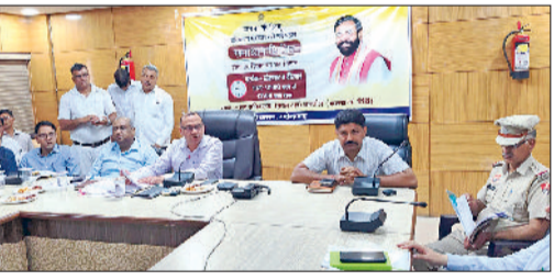
नारनौल। अधिकारियों की बैठक लेते डीसी डॉ. विवेक भारती।

डॉ. भारती ने अधिकारियों को स्पष्ट निर्देश दिए कि सोशल मीडिया ग्रीवेंस ट्रेकर पर आने वाली शिकायतों का समाधान 48 घंटे के