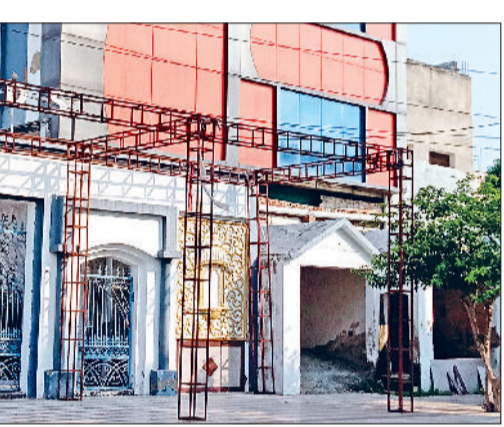
नारनौल। शहर में चल रहा एक होटल।

गौर करने वाली बात यह है कि यहां कभी-कभार पुलिस तो नजर आ जाती है, कभी जांच के नाम पर खानापूत कराने तो कभी बहती गंगा में हाथ धोने के चक्कर में, लेकिन इन पर कोई अंकुश नहीं है। यही वजह है कि इन होटलों में न केवल खटिया का इंतजाम किया जा रहा है, बल्कि सरकारी नियमों एवं शर्तों का भी खुलेआम उल्लंघन किया जा रहा है। इससे अकेला