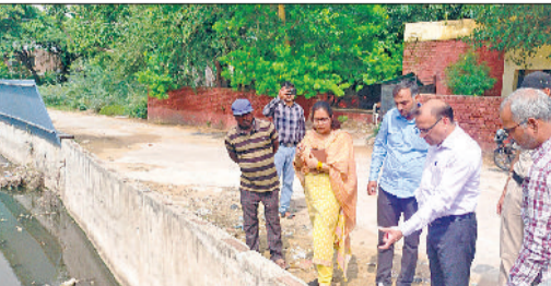
नारनौल। शहर में छलक नाले की सफाई व्यवस्था का जायजा लेते डीसी डॉ. विवेक भारती।

हरियाणा सरकार के निर्देश अनुसार मानसून के मौसम में शहरी जलभराव की समस्या से निपटने के लिए उपायुक्त डॉ. विवेक भारती ने शुक्रवार को नारनौल शहर का व्यापक दौरा किया। उन्होंने मुख्य रूप से छलक नाले सहित शहर के विभिन्न हिस्सों में सफाई व्यवस्था का जायजा लिया। इस निरीक्षण के दौरान डॉ. भारती ने कहा कि हरियाणा सरकार के स्पष्ट निर्देश हैं कि जिले के शहरी और ग्रामीण दोनों क्षेत्रों में सभी नालियों की सफाई व्यवस्था दुरुस्त होनी चाहिए। उपायुक्त ने निजामपुर रोड से अपनी निरीक्षण यात्रा शुरू की और छलक नाले के विभिन्न स्थानों पर सफाई कार्यों का जायजा लिया। उन्होंने विशेष रूप से छोटा-बड़ा तालाब