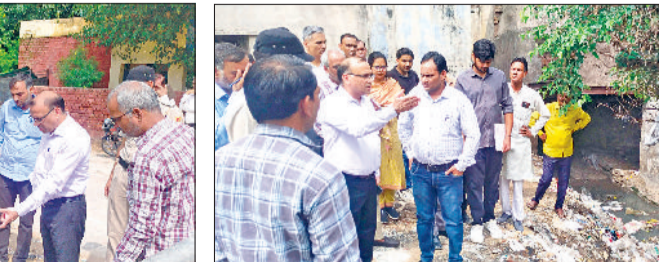
नारनौल। शहर में छलक नाले की सफाई व्यवस्था का जायजा लेते डीसी डॉ. विवेक भारती।

के पास नाले की सफाई के बाद पड़े कचरे को तुरंत हटाने के निर्देश दिए। इस दौरान डॉ. भारती ने छलक नाले के ऊपर बने पुल बाजार का भी निरीक्षण किया। उन्होंने वहां के दुकानदारों से बातचीत की और पुल के निर्माण का रास्ता निकालने के लिए आवश्यक कार्रवाई शुरू करने के निर्देश दिए, ताकि भविष्य में किसी प्रकार की असुविधा न हो। उपायुक्त ने निरीक्षण के दौरान अधिकारियों